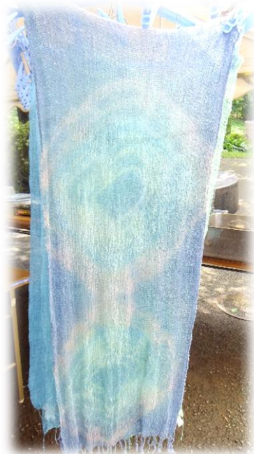
前の講習会の作品だよ。 今年はどんなスカーフができるかな？