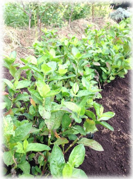
これが藍の葉っぱだよ

藍の葉っぱを使って絹のスカーフを染める講習会を行います。葉っぱを水の中でごしごしとこするだけでスカーフがキレイな青色に染まる不思議を体験してみませんか？また紅花も用意していますので、藍の青・紅花の赤・紅花の黄色で色の足し算もしてみましょ～♪